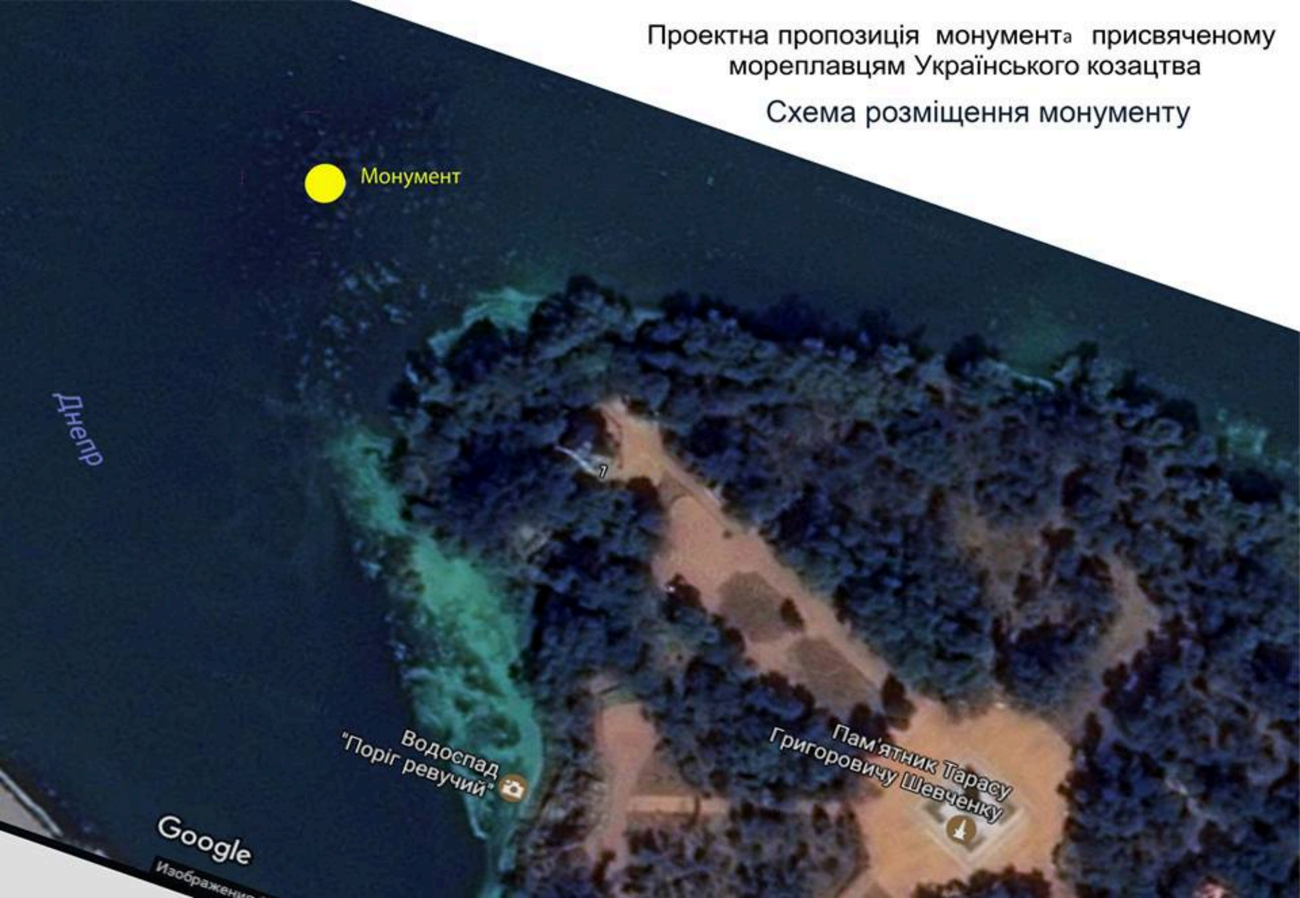
Схема розміщення монументу

Проектна пропозиція монумента присвяченому мореплавцям Українського козацтва